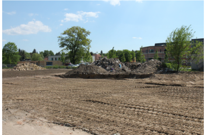
Gleicher Standort, einige Wochen später.