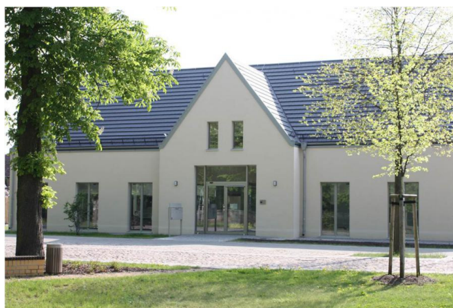
Anlaufstelle für kleine und große Leseratten - KultOurKate

Montag und Freitag: 10 bis 15 Uhr Dienstag und Donnerstag: 13 bis 18 Uhr jeden 1. Samstag im Monat: 10 bis 12 Uhr