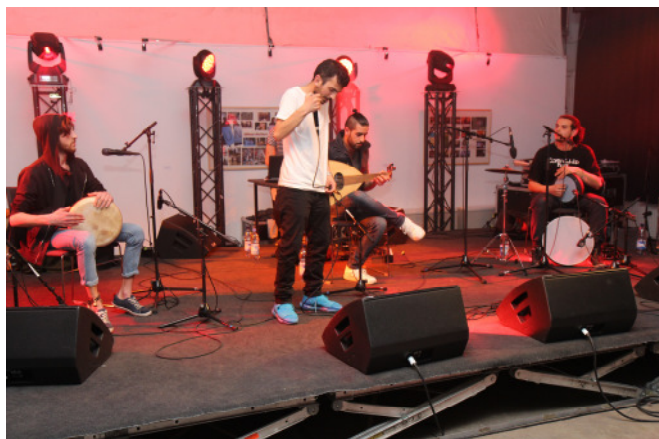
Gelebte Integration zum Musikfest mit der „Mazzaj Rap Band“