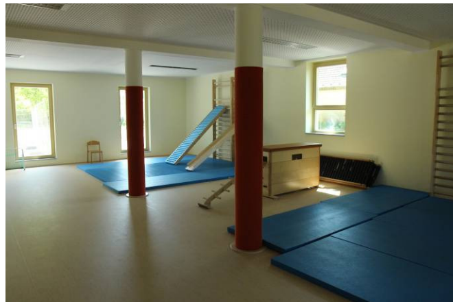
Genug Platz für sportliche Aktivitäten im Hort am Storchenturm