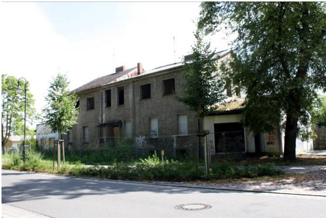
Lange ein unschöner Anblick

Die Abrissarbeiten auf den Grundstücken Dorfaue 7 und 9 sind abgeschlossen. Die Baugenehmigungen für privaten Bau altengerechter Wohnungen und Tagespflegeeinrichtung liegt vor. Der Neubau soll im Sommer beginnen.